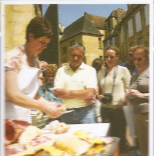
SARLAT Terroir dans l'assiette

Monts de Guéret, la station « Sports Nature » Eglise peinte de Sous-Parsat en Creuse