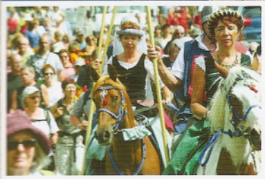
RICHARD CŒUR DE LION Rando-Festival