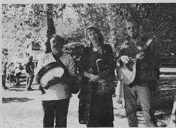
Le groupe musical Mandragore accompagnait le cortège.

était cette année répartie sur trois circuits. De ce fait, elle était moins spectaculaire avec un nombre des participants bien moindre. Même si les touristes étaient ravis du divertissement, les habitants, quant à eux, n'ont pas manifesté beaucoup d'enthousiasme. Ils ont préféré se rendre au marché de producteurs organisé ce même soir par l'association Marchés en fête sur la place de l'église.