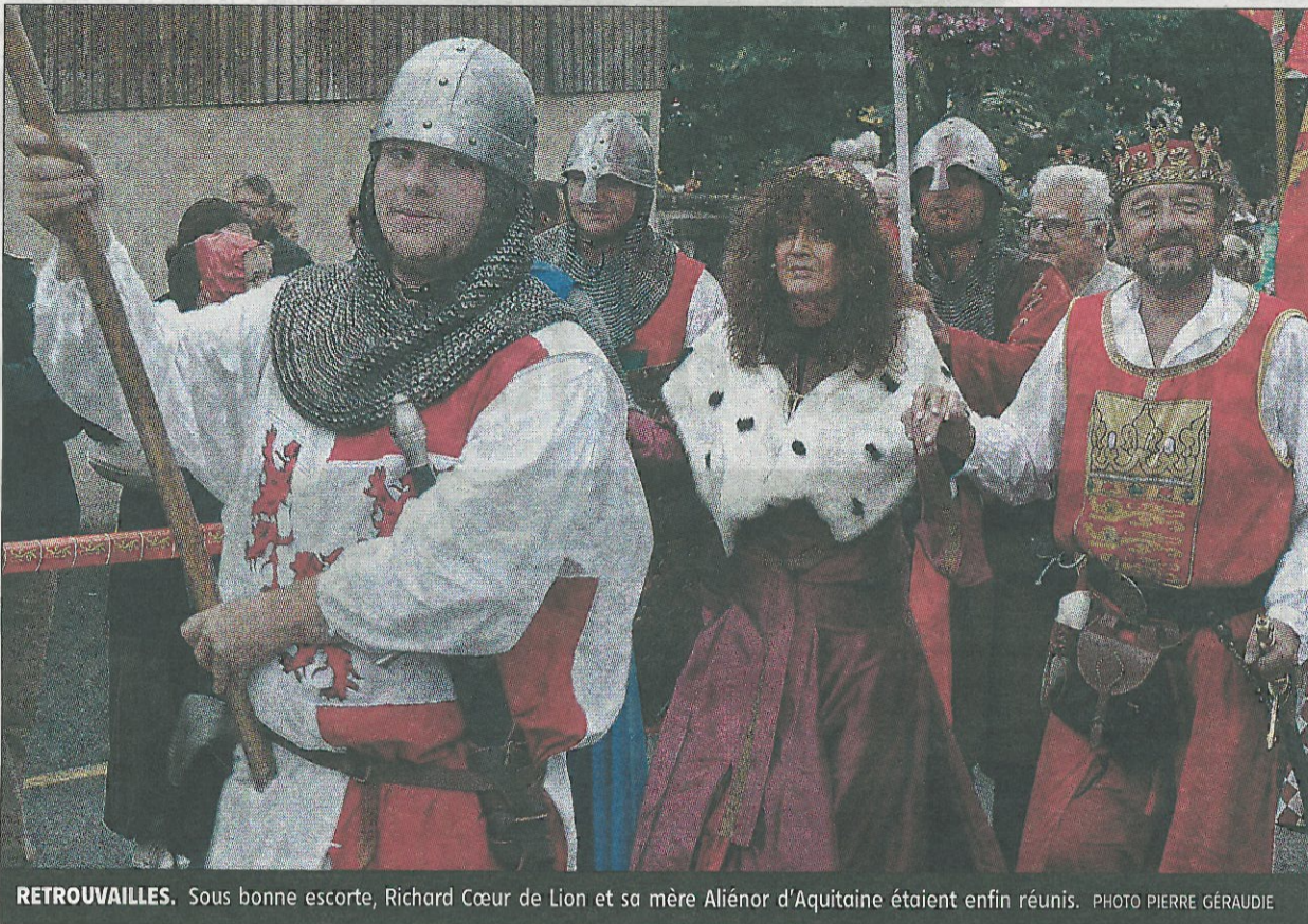
RETROUVAILLES. Sous bonne escorte, Richard Cœur de Lion et sa mère Aliénor d'Aquitaine étaient enfin réunis.

ges, La Rochefoucauld et Pompadour jeudi au petit matin, tous trois se retrouvaient à Châlus, où ils ne purent s'empêcher de quêter les vivats de la foule avant de passer aux choses sérieuses.