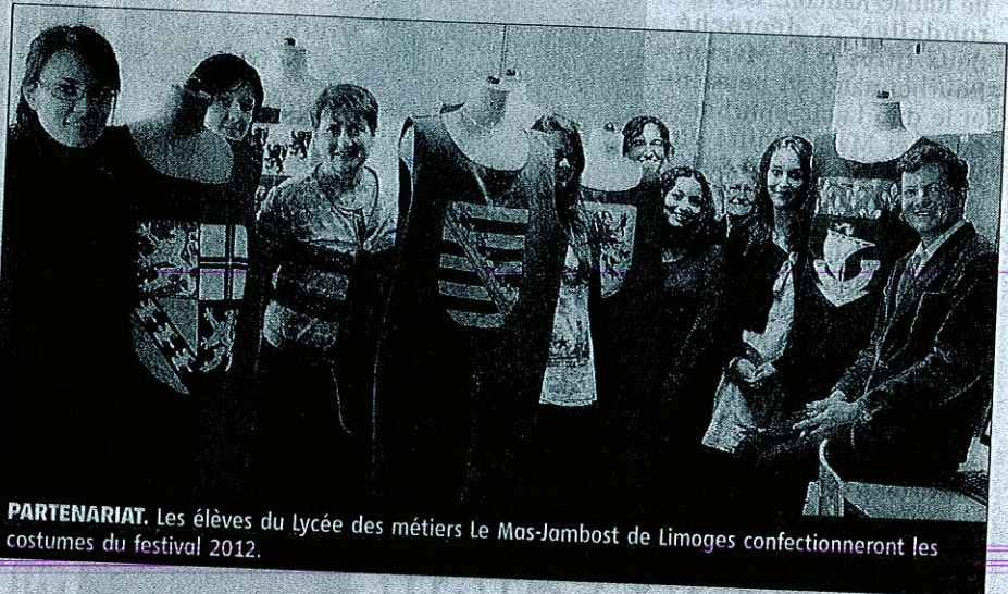
PARTENARIAT. Les élèves du Lycée des métiers Le Mas-Jambost de Limoges confectionneront les costumes du festival 2012.

D'autre part, le thème du futur festival sera "Richard-Cœur-de-Lion, star du cinéma". Son programme est concocté par des associations cinéphiles et s'adressera notamment aux amoureux du 7 e art. ■